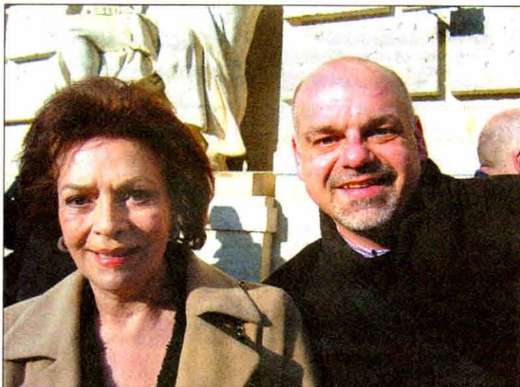
Auf Autogramm- und Fotojagd: Klaus Gericke mit dem ehemaligen Bond-Girl Karin Dor.